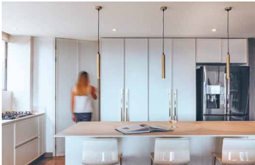
Con el fin de dar una apariencia limpia a la cocina, ocultaron tanto la zona de ropas como el lavaplatos.

Tras la intervención, la cocina, antes cerrada y poco iluminada, interactúa