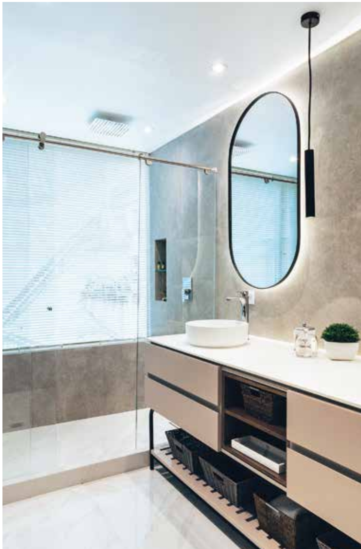
Los arquitectos incluyeron detalles de iluminación indirecta con el propósito de transmitir calidez.

El mobiliario fue, en su mayoría, reutilizado, por lo que los arquitectos tuvieron que tomar varias decisiones en función de las piezas existentes. “Aquí surgió un reto: lograr armonizar los acabados con los muebles. El piso, por ejemplo, lo escogimos en un color relativamente oscuro para que contrastara con las tonalidades beige , crudo y blanco de los muebles, y con una textura natural, rugosa, que compagina con la de los paneles y algunas piezas del mobiliario”, agrega Molina. Haciendo eco de las palabras de Barragán, MDV Arquitectura ha concebido una vivienda que destila serenidad y estética por igual. ■